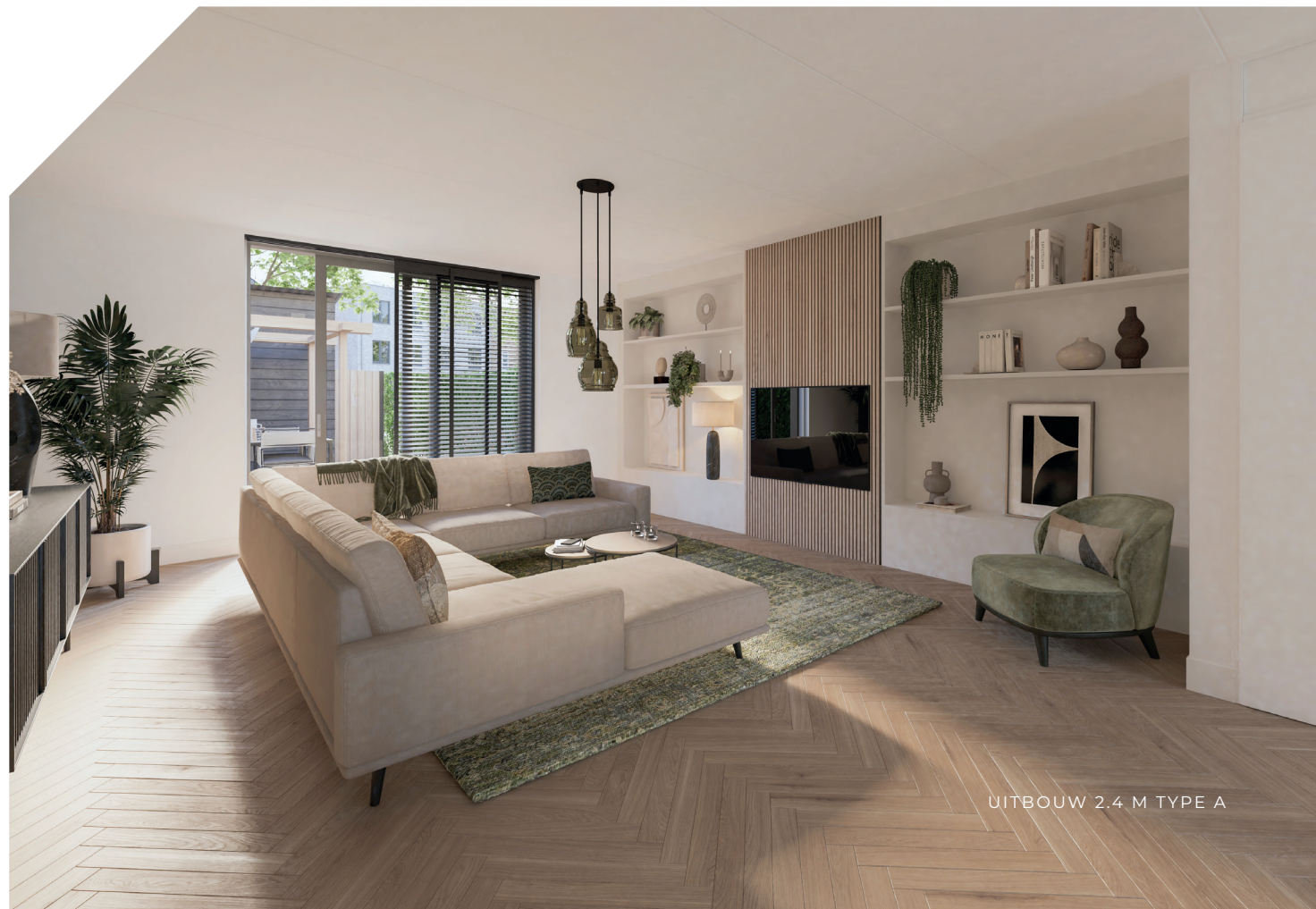
UITBOUW 2.4 M TYPE A

“De hoek- en tussenwoningen type A hebben 2 volledige woonlagen en een vrij indeelbare zolder. De woningen met een tuitgevel hebben extra ruimte op zolder, waar je een sfeervolle loungeplek of sportruimte kunt creëren.”