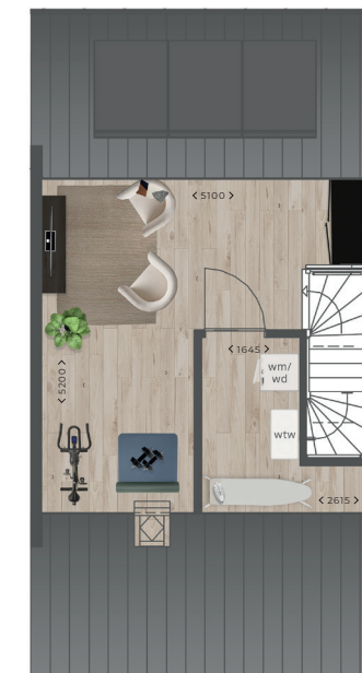
Tweede verdieping hoek- en tussenwoning bnr. 67, 68, 70 - 72, 74 - 76, 78 en 79(s)