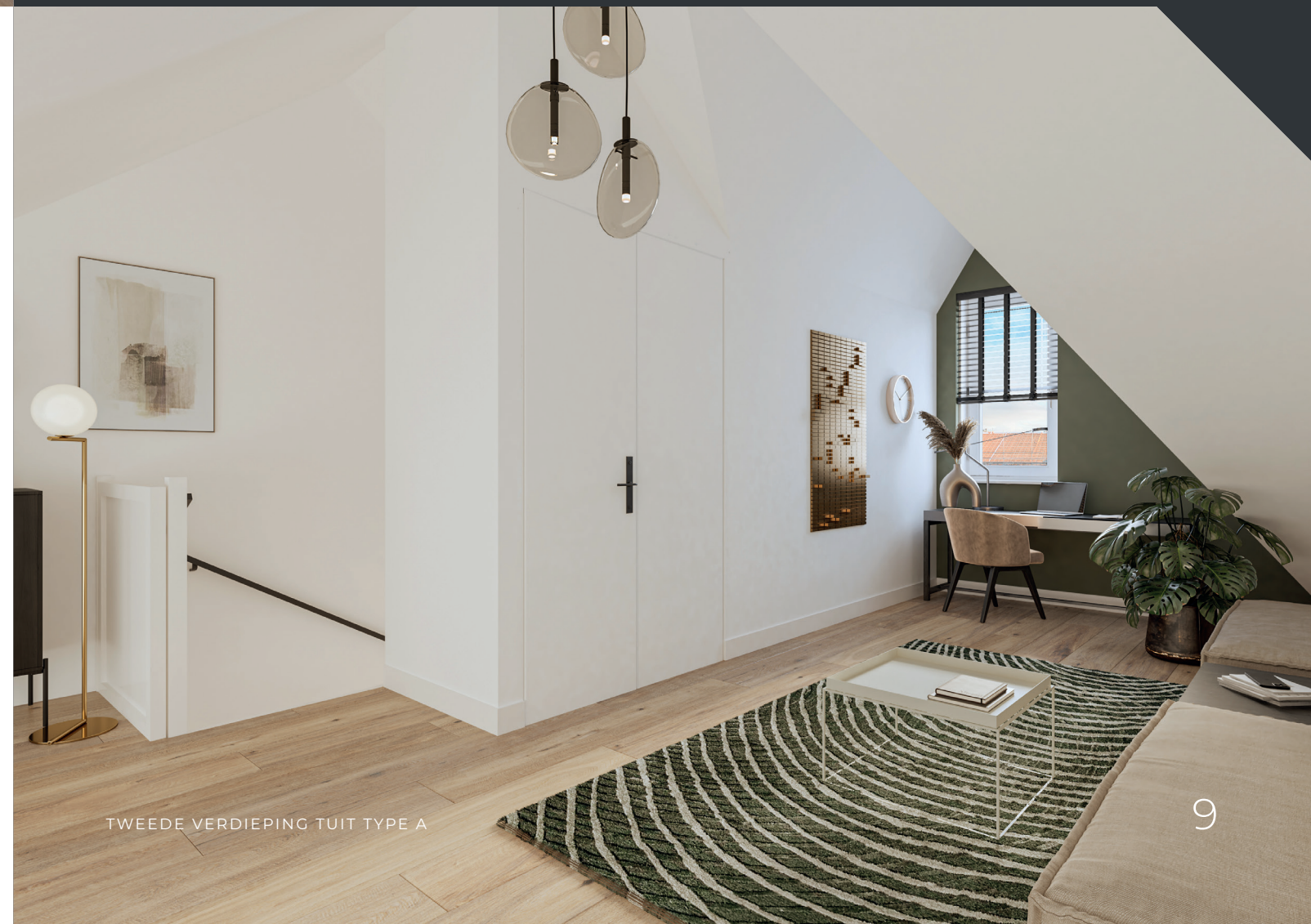
TWEEDE VERDIEPING TUIT TYPE A

“Breid de begane grond aan de achterzijde uit met 1,2 m of 2,4 m. Kies voor een bredere schuifpui van 3,1 m of 3,8 m voor meer lichtinval.”