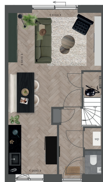
Begane grond tussenwoning bnr. 68 - 78