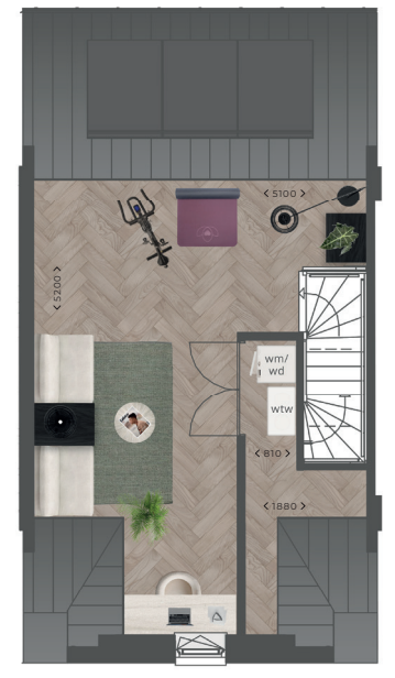
Tweede verdieping tussenwoning tuit bnr. 69, 73 en 77