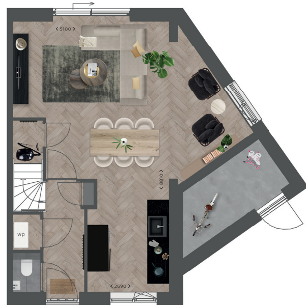
Begane grond hoekwoning bnr. 67(s) en 79